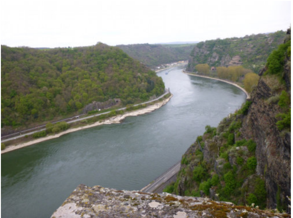
Blick auf die Loreley