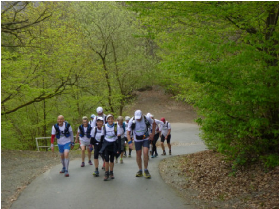
Laufen in der Gruppe - für manche ungewohnt

Die Wandergruppe bestimmt ihre Strecken von 20 bis 25 km selbst.