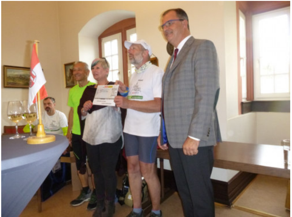
Spendenübergabe in Kiedrich