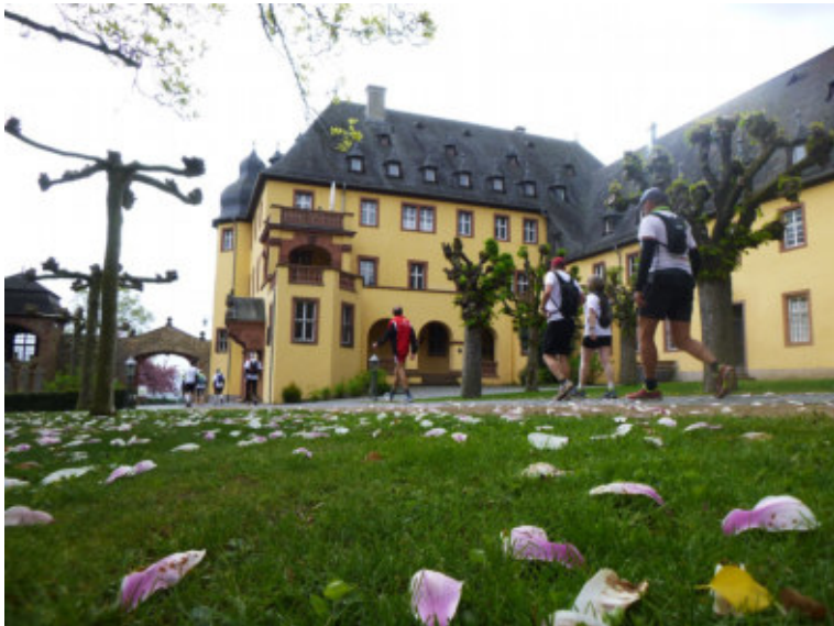
Zwischenstopp im Weingut Schloss Vollrads

Von 2006 bis 2017 zeigten sie hunderten LäuferInnen und WandererInnen das Rheintal im Laufschrift. Ziel war von Anfang an nicht, möglichst schnell das Tagesziel zu erreichen, sondern Landschaft und Gemeinschaft zu genießen. Unterwegs sammelten sie einen sechsstelligen Betrag für Benni & Co und gegen die Duchenne-Muskeldystrophie. Mit der 13. Ausgabe übergaben sie das Staffelholz an vier langjährige TeilnehmerInnen.