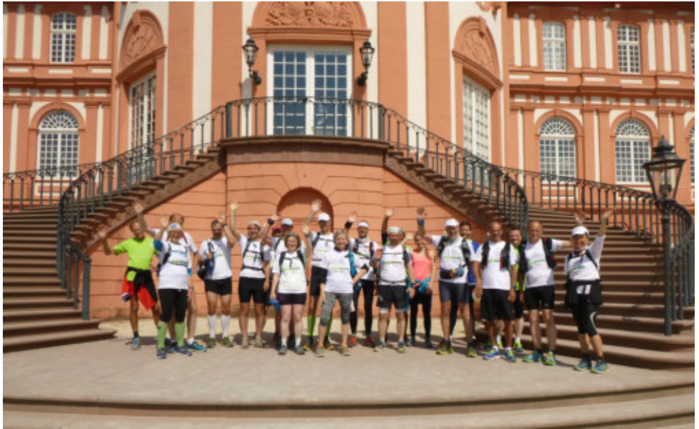
Das Ziel: Schloss Biebrich

Anmeldeschluss für Strecken mit Übernachtung ist spätestens am 17. Februar – wenn nicht schon vorher alle Betten belegt sind.